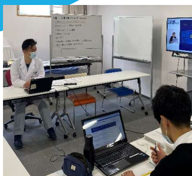
太田医長より ペースメーカーについて