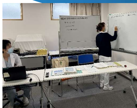
村田医師より PCPS について

こうして演習を通して受講生と指導医師が顔を合わせると、指導医師が受講生の到達度を把握することもできます。また、当院初めての特定行為研修であるため、指導医師も何を教えて良いのか、何を実習するのかもわからない状態でのスタートでしたが、演習内容を通して、「実習ではこんなことを受講生とやる感じで良いのね。」と、擦り合わせることができる貴重な時間でした。演習にご協力して下さる医師や薬剤師さん、看護師さんに感謝致します。