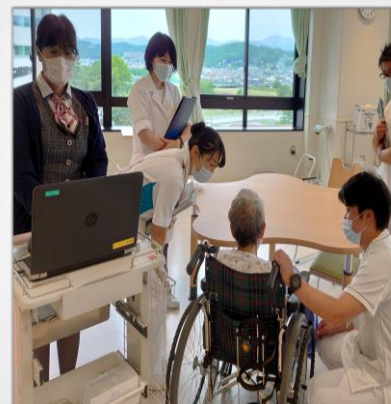
認知症ケアチーム