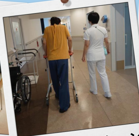
リハビリテーション