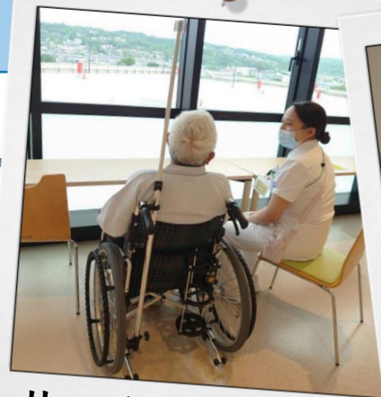
リハビリテーション