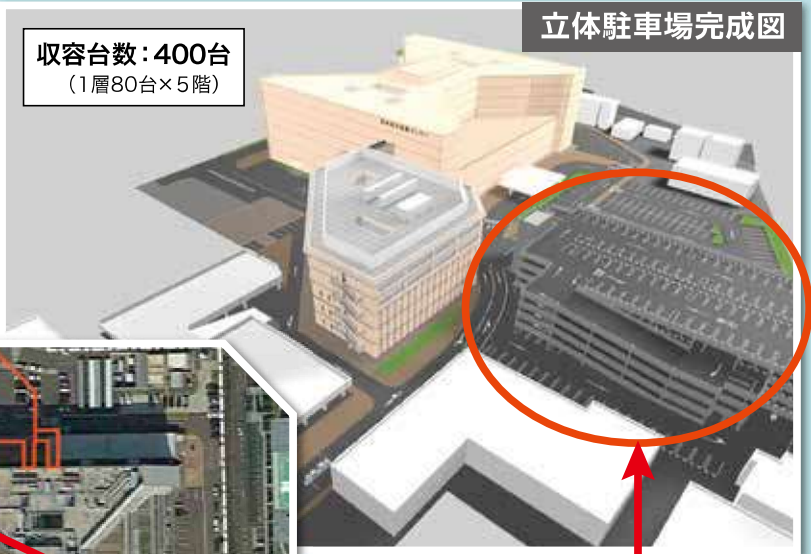
立体駐車場完成図

立体駐車場は4層5階建ての構造で収容台数は400台です。完成は平成29年10月頃を予定しています。工事期間中はご迷惑をお掛けしますが、何卒、ご理解・ご協力の程、よろしくお願い申し上げます。